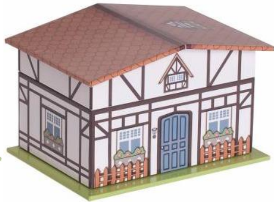
1342C TUDOR COTTAGE