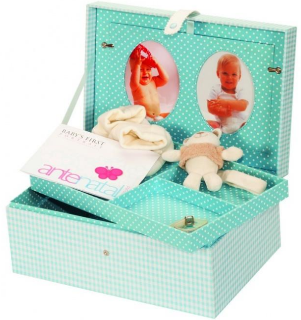
636 PAMÄTNÝ BOX MODRÝ