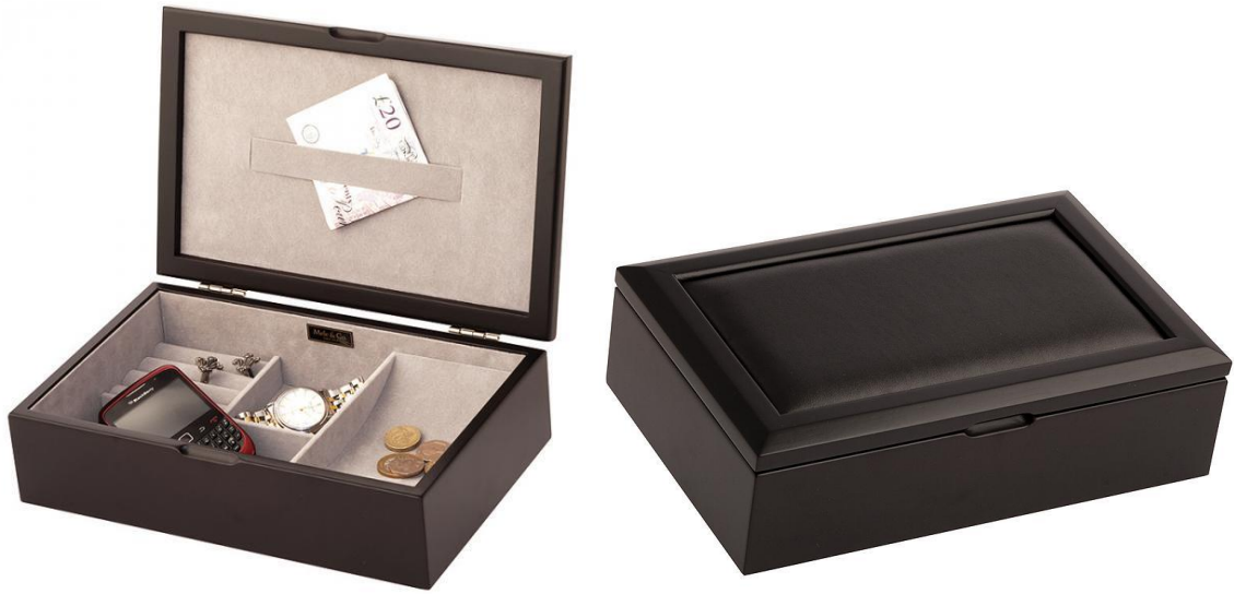
440SP JAVA ORG