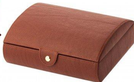
1516 ORGANISER BROWN