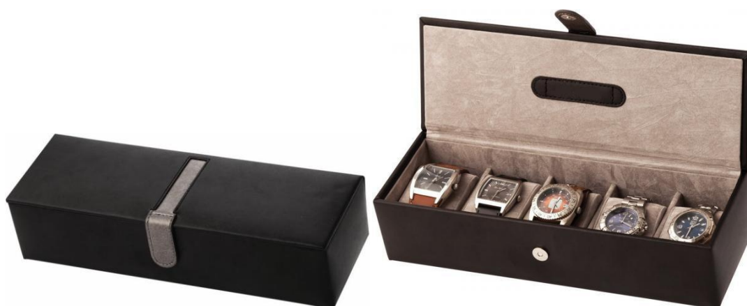
1500 WATCH BOX