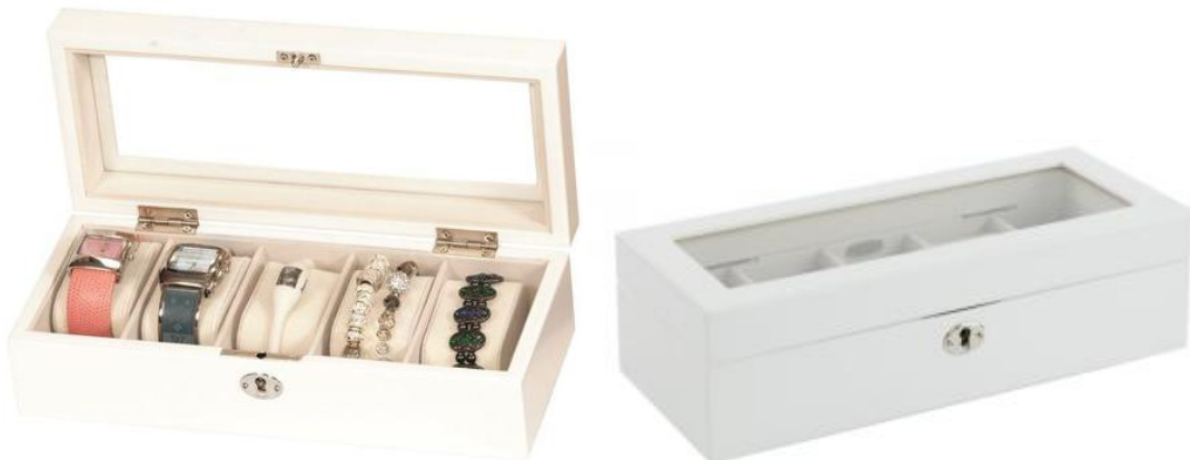
435 C-5 WATCHBOX