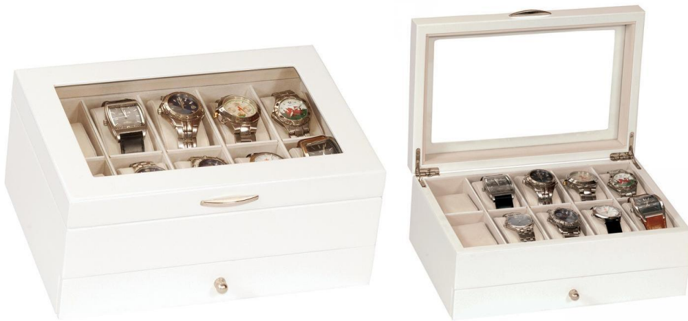
430 WATCHBOX C-10