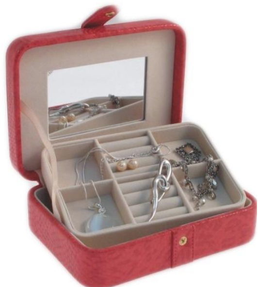
5017 HANNAH 13,40 €