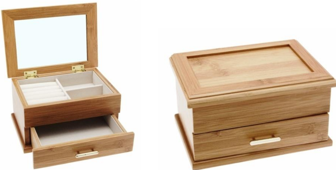
472 SP ANNETTE