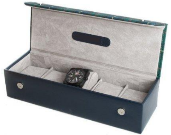
1528 WATCH BOX