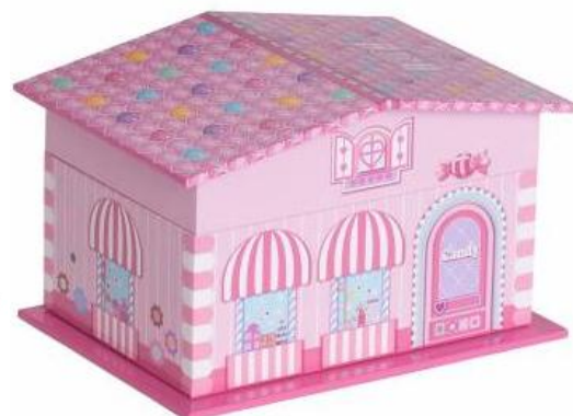
1344C CANDY STORE