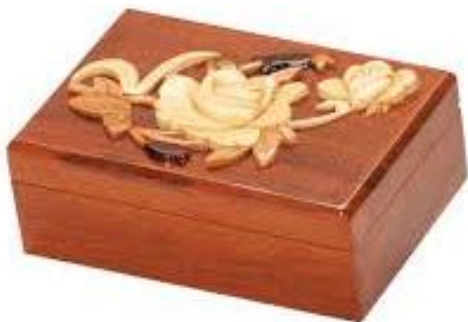
1497 ANASTASIA, veľká