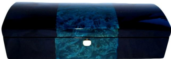
151 WATCH BOX