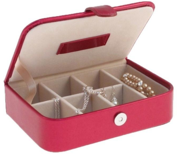
5036 B – GRACIE