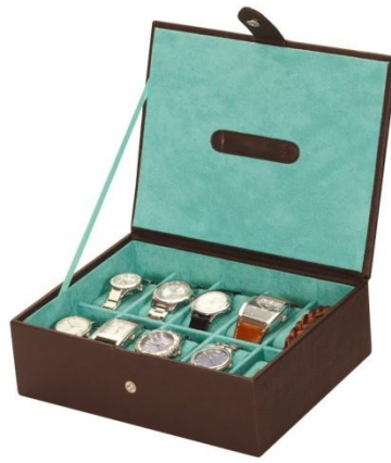
1522 WATCH BOX