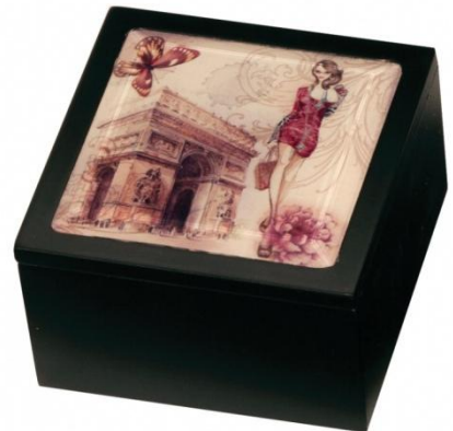
1824 WOOD GIRL