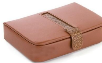
1511 CUFFLINK BOX