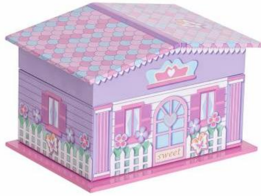
1341C SWEET SHOP