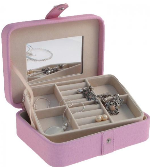
5005 MIA 12,60 €