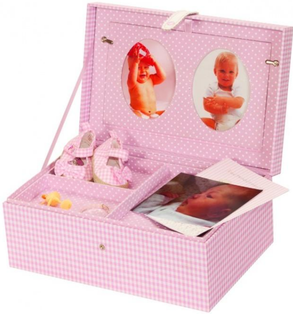
635 PAMÄTNÝ BOX RUŽOVÝ