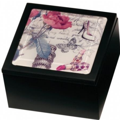
1823 WOOD TOWER