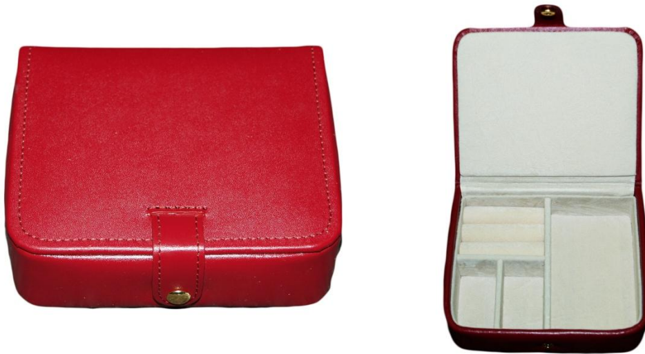
770R TRAVEL CASE