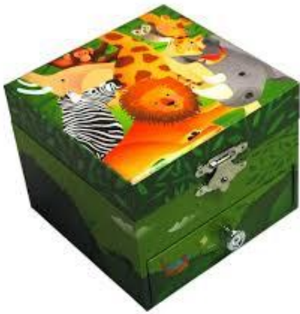
1348 ZOO TEDDY